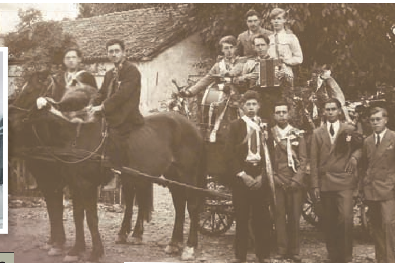
Proslava, najvjerovatnije vjenčanje, ranih 1930-ih