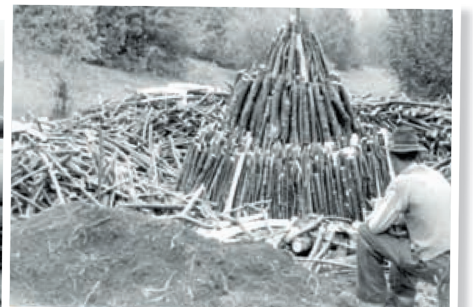
Priprema ugljare u okolici Žejana, 1962.