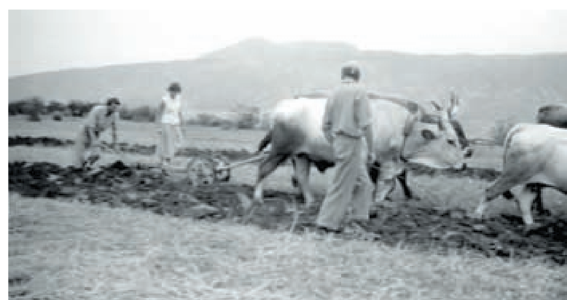
Draga 1960-ih, u pozadini Učke