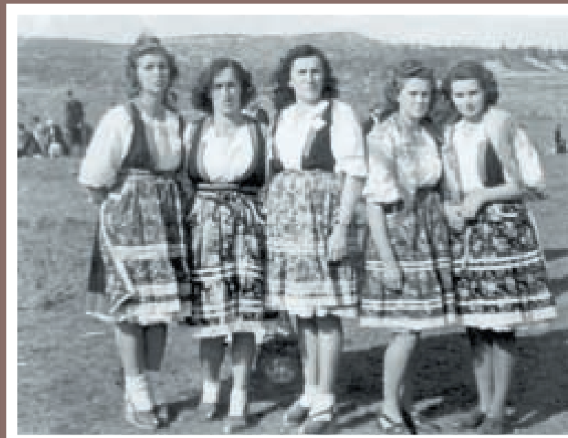
Djevojke iz Žejana i Muna u tradicionalnoj nošnji 1940-ih