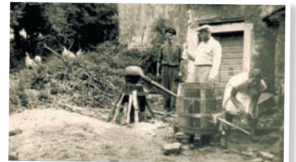
Pečenje rakije od komine, Gorinci, Brdo, 1952.